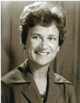
Slika 6. Biologinja dr. Danica Tovornik (1927–2012).