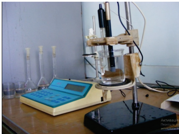
Рисунок 10. Ионометр рХ-150.1М1

суспензии с помощью ионоселективных электродов. Потенциометрический метод основан на измерении потенциала ионоселективного электрода, величина которого зависит от концентрации ионов, которые определяются в растворе. В качестве вспомогательного электрода используется насыщенный хлорсеребряный электрод. Измерение концентрации ионов pNO_3 проводилось на ионометре рХ-150.1М1 (рис. 10).