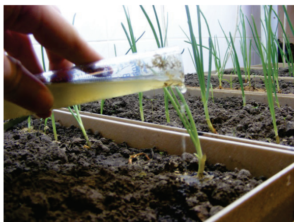
Рисунок 6. Полив лука водным раствором шлама биогазовых производств