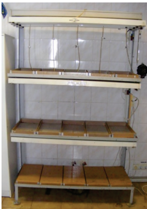
Рисунок 1. Лабораторно-экспериментальная установка, на которой проводилась выгонка лука на перо

Исследование осуществлялось на лабораторно-экспериментальной установке (рис. 1), которая находится в учебно-научной лаборатории биоконверсий в агропромышленном комплексе Национального университета биоресурсов и природопользования Украины.