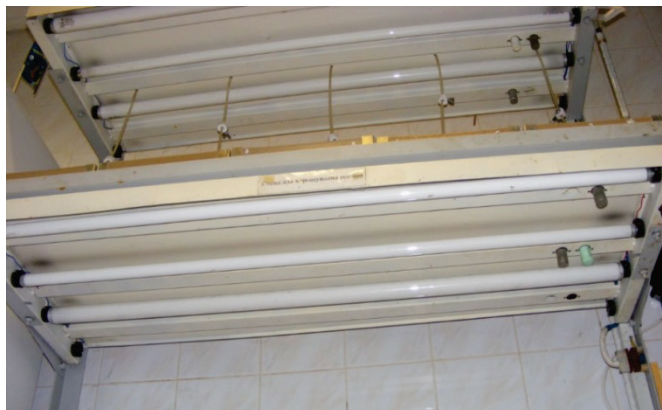
Рисунок 3. Оборудование для досвечивания растений на лабораторно-экспериментальной установке, на которой проводилась выгонка лука на перо

Шлам биогазовых производств получался в результате метанового сбраживания в термофильном режиме (50°C) разбавленной водой твердой фракции навоза КРС до влажности 92% на лабораторной биогазовой установке с объемом метантенка 30 л (рис. 4). Время сбраживания составляло 25 суток.