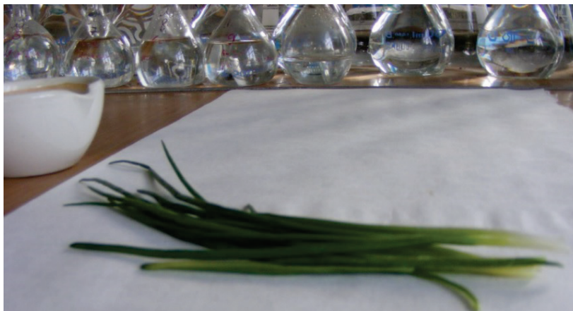
Рисунок 8. Срезанные перья лука, выращенные согласно одному из вариантов исследования

Навеска помещается в стакан гомогенизатора, доливается 50 мл 1% раствора алюмокалиевых квасцов и гомогенизируется 1 мин. при перемешивании с частотой 6000 об./мин. После гомогенизации суспензия переносится в лабораторный стакан объемом 100 мл (рис. 9).