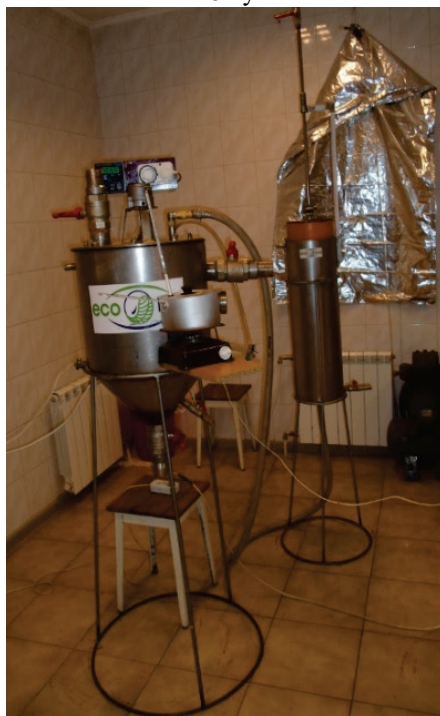
Рисунок 4. Лабораторная биогазовая установка

Шлам биогазовых производств получался в результате метанового сбраживания в термофильном режиме (50°C) разбавленной водой твердой фракции навоза КРС до влажности 92% на лабораторной биогазовой установке с объемом метантенка 30 л (рис. 4). Время сбраживания составляло 25 суток.