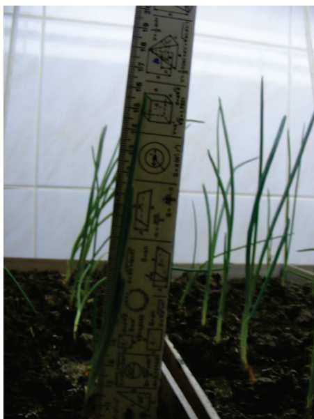
Рисунок 7. Измерение высоты перьев лука

Результаты определения урожайности лука на перо. При подкормке растений чистой жидкой фракцией биошлама четыре растения из семи погибли. В других вариантах опытов гибели растений не наблюдалось. Наибольшая средняя высота растений на седьмые сутки выращивания отмечалась при подкормке смесью жидкой фракции биошлама с водой в концентрации 1:50-1:500 и раствором минеральных удобрений и колебалась в пределах 19-21,5см, хотя высота отдельных растений достигала 27см. Следует отметить, что при подкормке чистой жидкой фракцией биошлама высота отдельных растений, которые не погибли, составляла 23см. Высота лука на перо на седьмые сутки выращивания приведена в табл. 2.