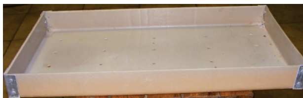
Рисунок 2. Пластиковый ящик, в котором осуществлялось выращивание растений

Установка состояла из рамы, на которую устанавливался поддон, в который помещались пластиковые ящики (рис. 2) с грунтом. В дне ящиков были сделаны отверстия для стока избытка жидкости. Над ящиками размещались люминесцентные лампы дневного света для досвечивания рассады (рис. 3).