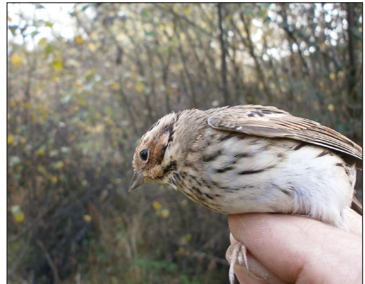
Slika 4: Mali strnad Emberiza pusilla, Bistrica, Šentrupert, Slovenija, 13. 10. 2017, obroček KV 33445