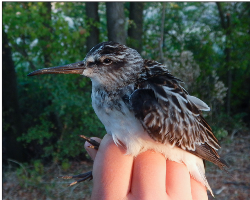
Slika 3: Ploskokljunec Calidris falcinellus, Sečoveljske soline, Portorož, Slovenija, 29. 8. 2017, obroček VC 410